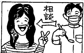
イラスト・めいもも